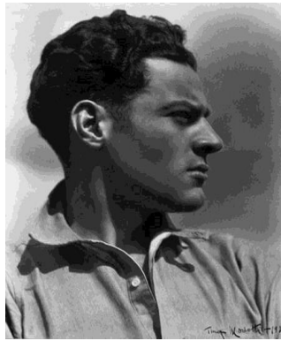
Julio Antonio Mella